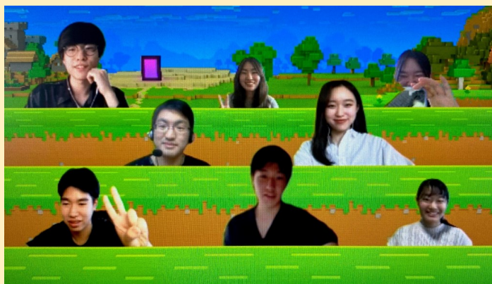
↑ Speaking Sessionの後に集まって団らんする学生たち

Speaking Sessionの後に1つのビデオ会議ルームにみんなで集まり、授業について話したり、ただおしゃべりしたり、オンラインゲームなどをして交流を深めています。たまに、時間を忘れて話し込んでしまうこともあるくらい楽しい時を過ごしています。オンラインならではの交流を大切にしながら、実際に会える日を楽しみにしています。(池田摩耶)