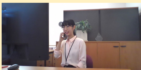
↑ 学生と英語で話しているSSO

4月27日(火)から、SSOと学生が毎週15分間、音声通話機能を用いてマンツーマンで英会話をする1 on 1 Conversation Sessionを行っています。ビデオ通話とは異なり、対話相手の顔が見えない環境での英会話は慣れないこともあるようですが、1対1で日常会話を練習する良い機会になっているようです。