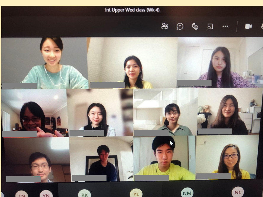
TELC Ultimoの先生方が授業を受けている14期生の様子を撮影してくださいました。

学生たちが4月19日(月)から受講開始したTELC Ultimoの英語コースは、月曜日から金曜日まで毎週5日間、日本時間午前8時30分から午後1時30分まで、途中1時間の休憩をはさみ、1日4時間オンラインで授業が開講されています。各クラスには、14期生以外にも他の国からオンラインで授業に参加している留学生もいます。