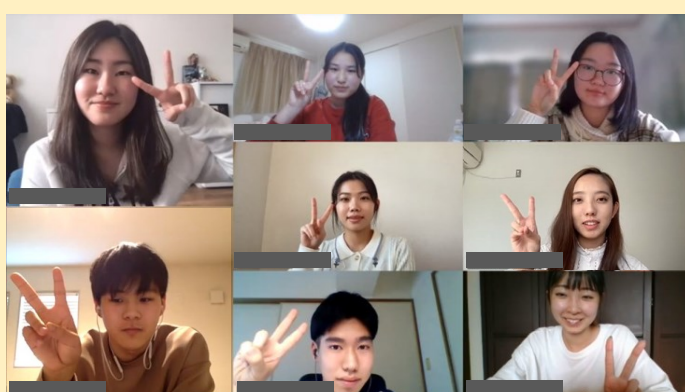
↑ 第1回のプログラム募集でパートナーが決まった学生たち