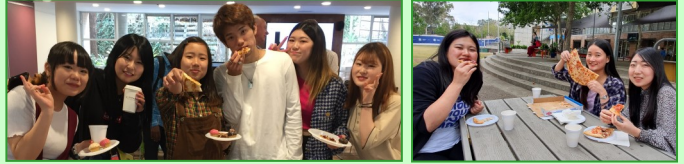
TELCがランチにピザやデザートを用意してくれました。