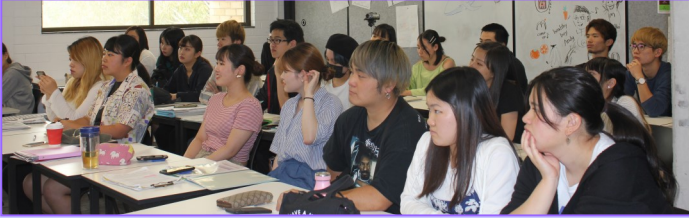
↑SSOの説明を聞く学生たち

12月6日(金)にサポート終了&ビザセミナーを行いました。ビザに関することは、法律で定められている通り、資格のあるビザコンサルタントに相談するようアドバイスしました。また、4月の渡航直後から始まったBenesse GCAのサポートが1月31日(金)にて終了いたします。これに伴い、サポート終了後の注意点を説明しました。