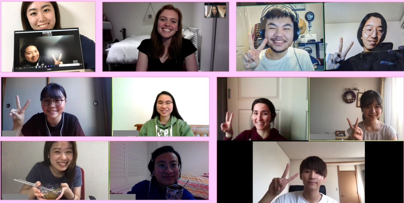
↑日本とオーストラリアのスイーツを紹介しました！

現地の大学で日本語を勉強している大学生とペアを組んだ学生たちは、ビデオ会議を利用してパートナーとお互いの言語を教え合うだけでなく、休日や放課後に一緒にお菓子を食べたり、料理をしたり、日本語や英語のクイズを出し合うなど、工夫して楽しみながら交流を深めているようです。