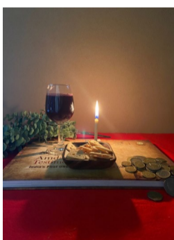
↑フォトグラフィーの授業の課題

オンラインで専門的なことを学ぶには、リスニング力がとても重要だと思います。授業では、学術的な英単語がたくさん使われるので、TELCでEAPを受講しておくことをお勧めします。