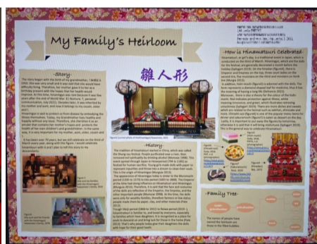
↑デザインの歴史を学ぶ授業で提出した課題