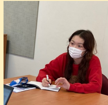
BGCAオフィスでSSOと面談をする学生