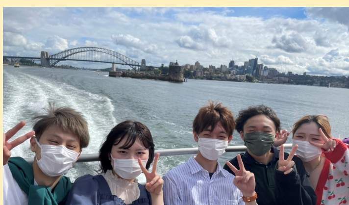
↑フェリーからハーバーブリッジと一緒に記念撮影!

学生たちは、放課後や休日にホストファミリーや友だちと出かけたりして、シドニーの観光を楽しんでいます。