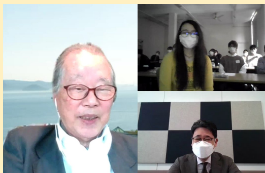
質疑応答の時間に自ら質問をする学生たち