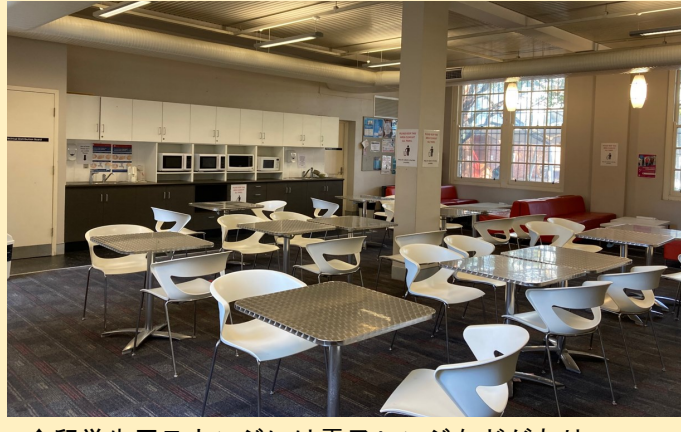
↑留学生用ラウンジには電子レンジなどがあり、休憩時間や放課後に利用する学生が多いです。