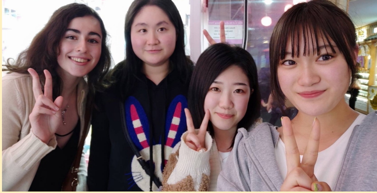
↑他のペアと一緒にディナーを食べました！