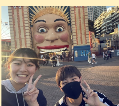
↑ルナパークに行って来ました！