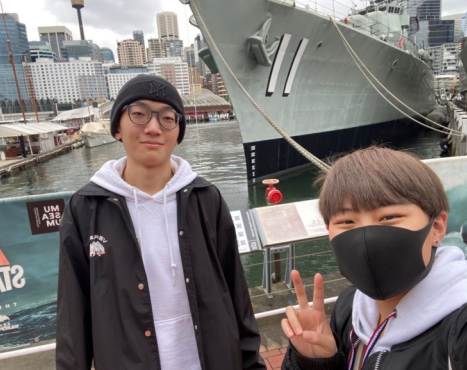
↑ダーリングハーバー周辺を散策しました。