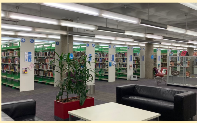
3フロアの図書館はとても広く、本を借りたり、パソコンや学習スペースを使って自主学習をすることができます。