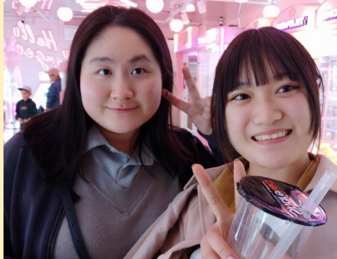
↑中華街にランチを食べに行きました。