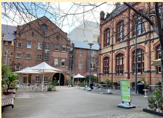
↑中庭は由緒ある風情の建物で囲まれています。