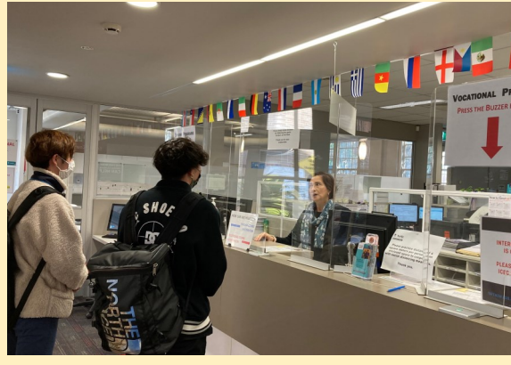
TELC Ultimoの教室と同じ建物の地上階に、留学生サポートの受付があり、手続きや留学生活に関する質問や相談ができます。