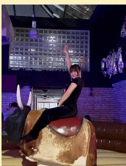
Language Exchangeパートナーが通っている大学の学期末を祝う Silent Disco Partyに誘ってもらい、ロデオマシーンに挑戦しました！