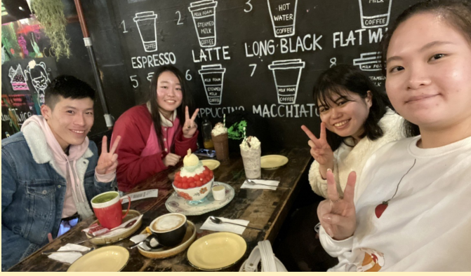
↑他のペアと合流してカフェで英語と日本語でお喋りを楽しみました。

4月下旬から始まったランゲージ・エクステンジプログラムでは、多くの学生がペアを組んだ現地の大学生とオンラインや対面で交流を楽しんでいます。