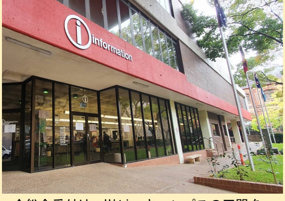
↑総合受付は、Ultimoキャンパスの正門を入ってすぐの所にあり、TAFEカードやコース修了書の発行などができます。