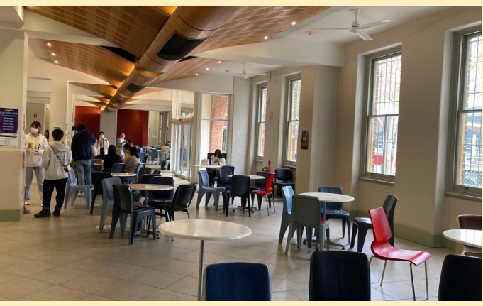
キャンティーン(学生食堂)