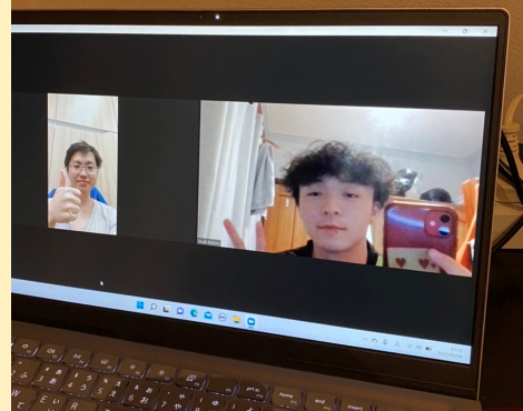
↑オンラインでお互い自己紹介をしました。