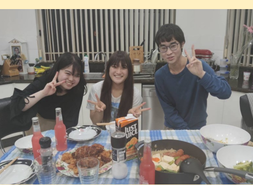
ホームステイ先と一緒にトンカツや鍋など日本食を作って食べました！