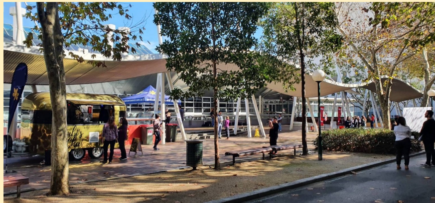
↑キャンパス内の屋外エリアには移動販売車が来たり、チャリティイベントが開催される日もあり、賑やかな雰囲気が漂っています。